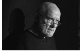
Peter Lindbergh, London, 2016