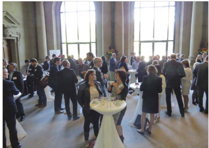
Mittagspause im Vestibül des Justizpalastes