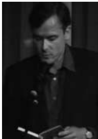
Lesung von Axel Hacke