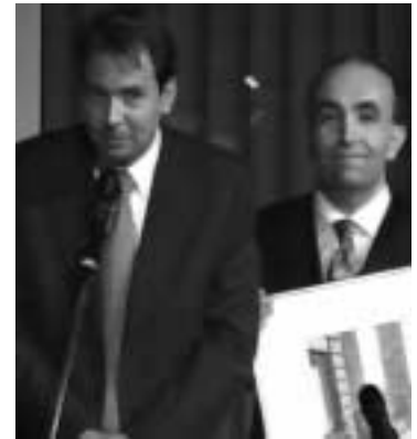
Glückschancen bei der Tombola mit „fliegendem“ Hauptpreis von telego! und weiteren Sachpreisen!