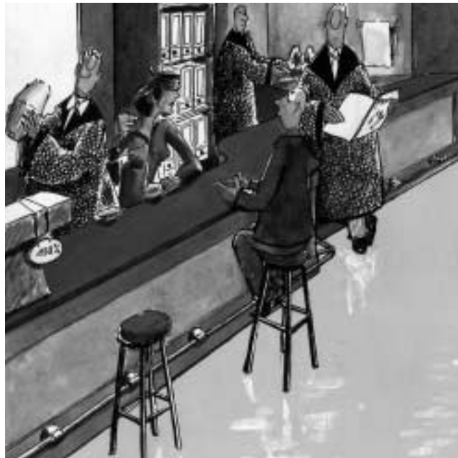
„Verschnaufpause an der Justizbar“

Das Heft mit dem Drehmoment (wenden, drehen und die 4. Ausgabe der BAV-Mitteilungen lesen)