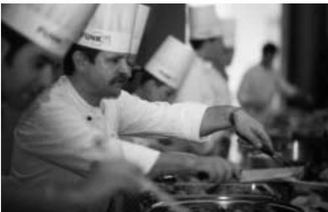
für das leibliche Wohl war bestens gesorgt