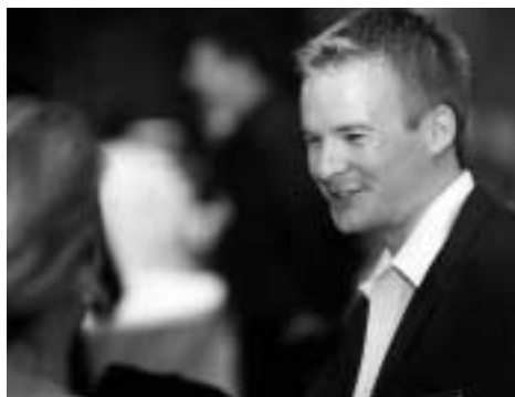
gut gelaunte Gäste, entspannte Gespräche