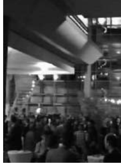
Ausstellung „Akte statt Akten“ (W. Maier), Begegnungen, Gespräche im großzügigem Ambiente des Hypo-Atriumhauses