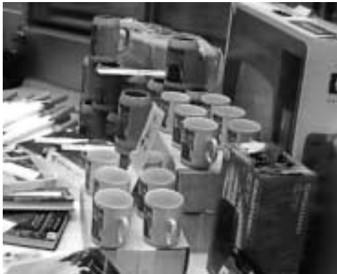
Die Tombolapreise, rechts das verlorste Bild von Philipp Heinisch, im Detail auf der Titelseite dieser und letzter Ausgabe