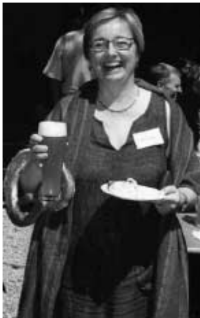
Eine fröhliche Vorsitzende am letzten Tag des DAT in München