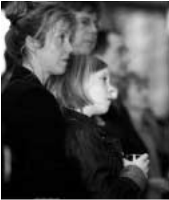
für jeden etwas, auch für ganz junge Gäste