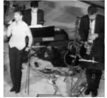
Musik, Gesang und Rhythmus